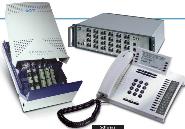
Schwarz Lichtgrau (weiß) Dunkelblau Die COMfortel-Systemtelefone stehen in diesen 3 Farben zur Verfügung.